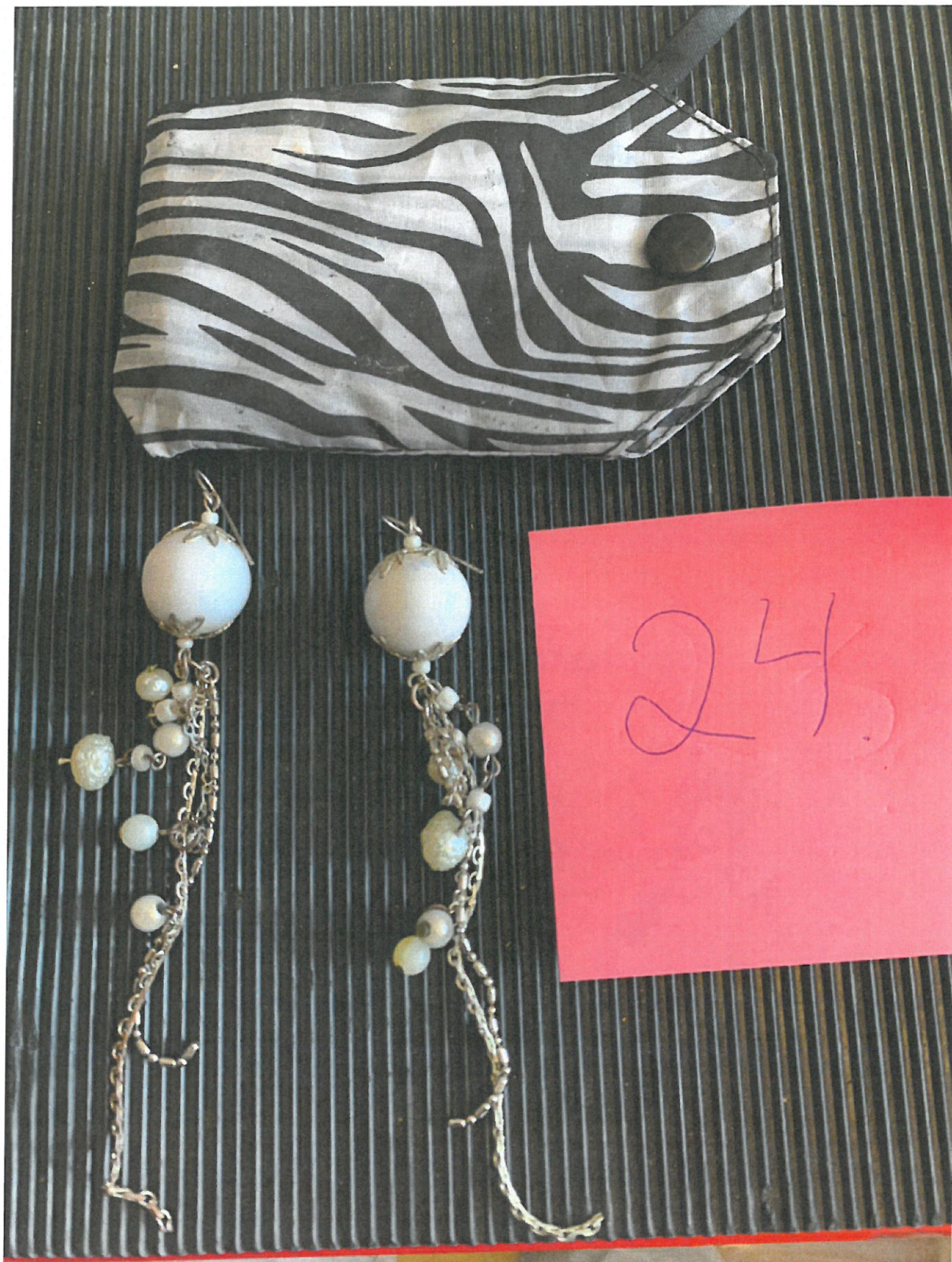
15. Beslagspunkt 24 i beslagsprotokoll 2020-5000-BG73289