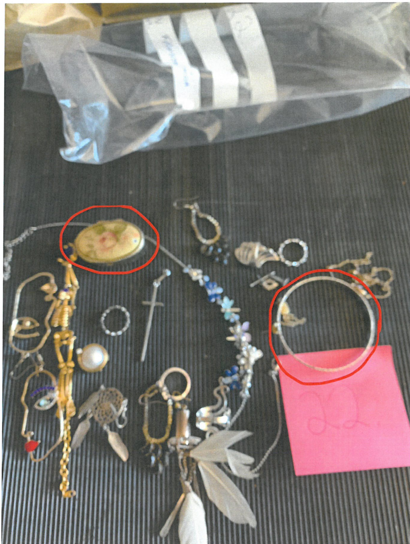
16. Beslagspunkt 22 i beslagsprotokoll 2020-5000-BG73289