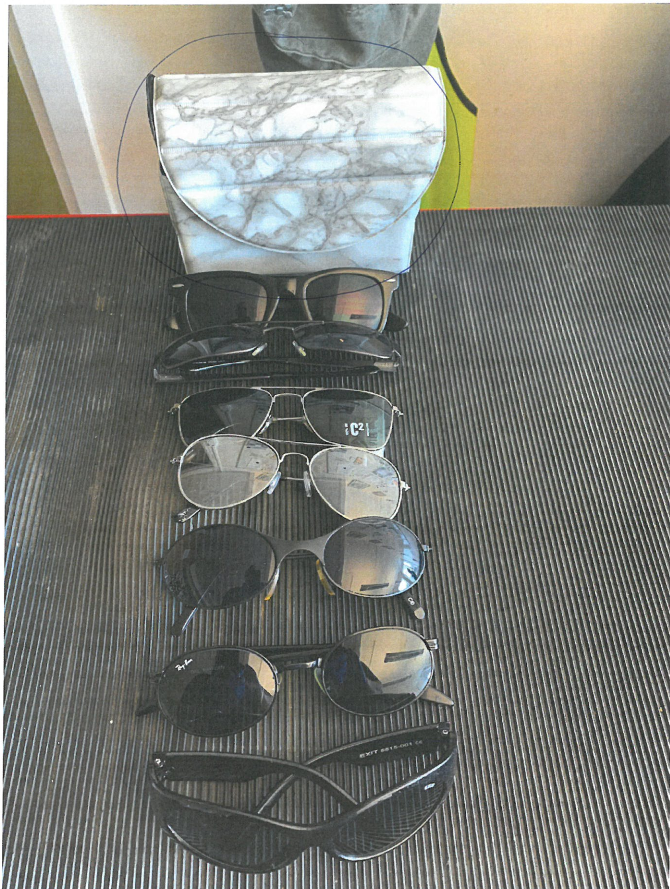
25. Beslagspunkt 3 i beslagsprotokoll 2020-5000-BG73289