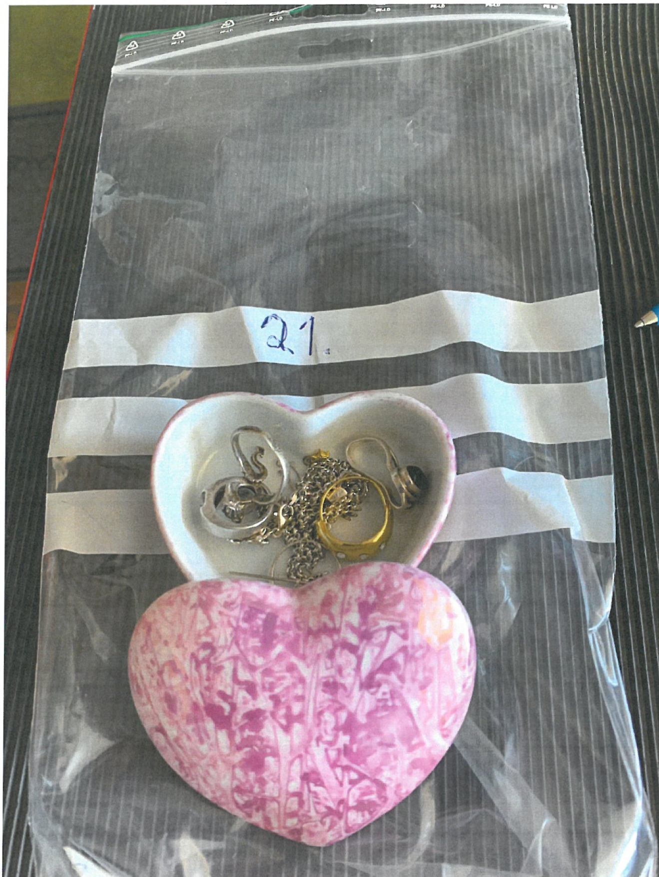
17. Beslagspunkt 21 i beslagsprotokoll 2020-5000-BG73289