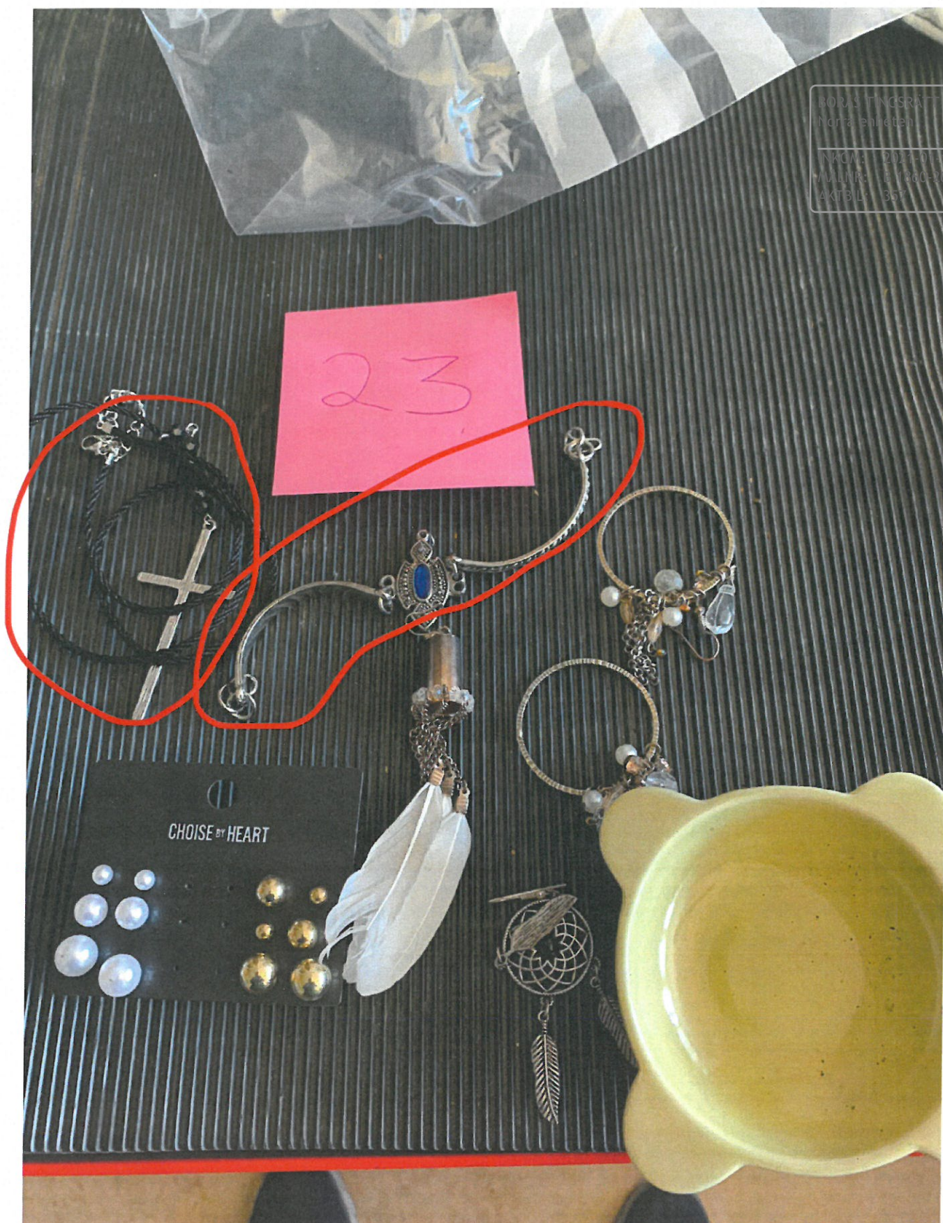
14. Beslagspunkt 23 i beslagsprotokoll 2020-5000-BG73289