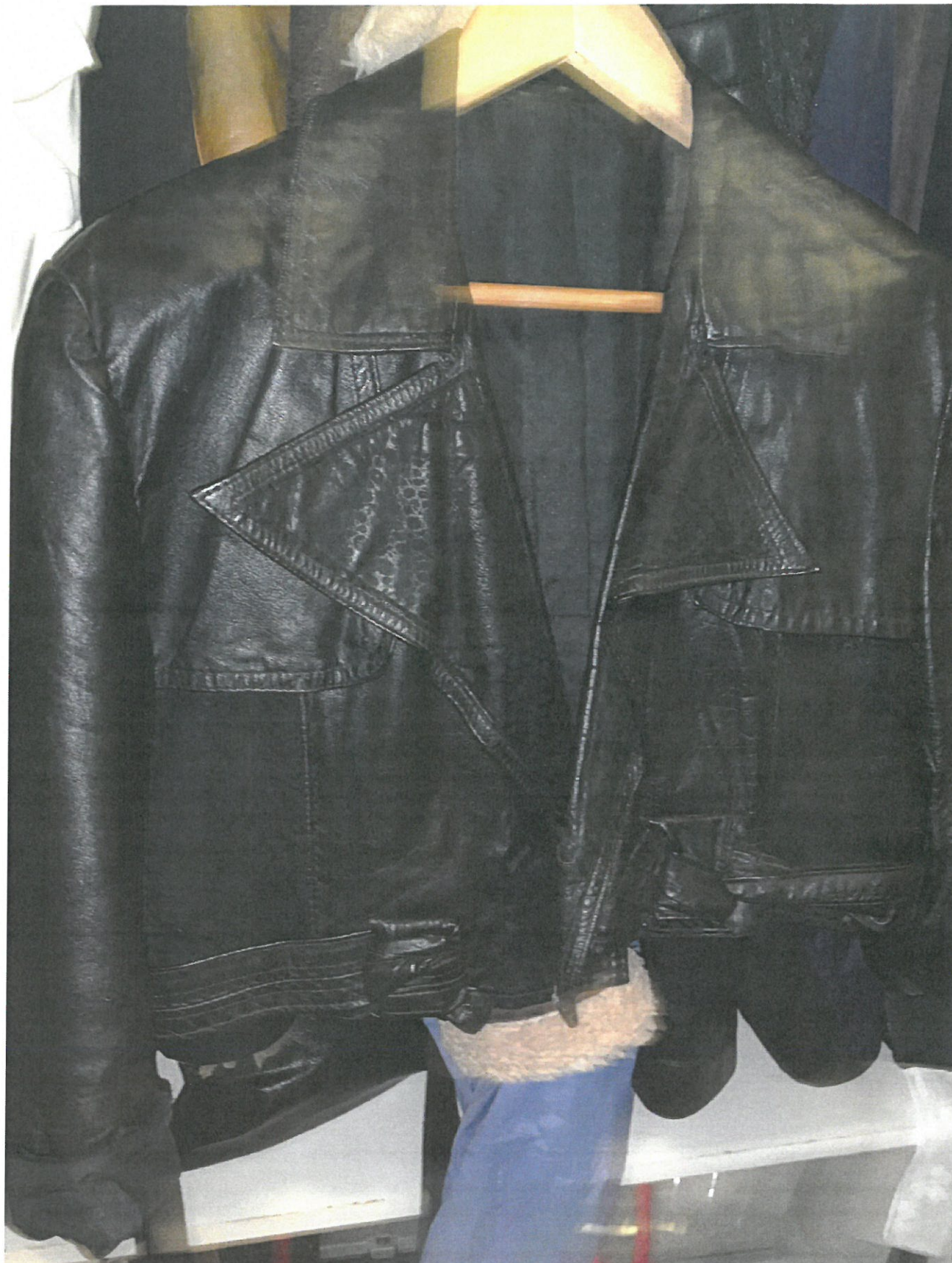
12. Hallen: En beslagtagn skinnjacka.