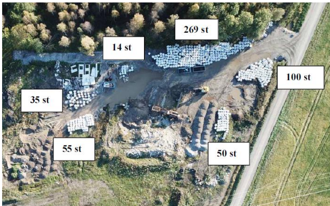
Bild 2020-03-09 från Härminge 1:5, Örebro kommun, med ca 520 vita storsäckar, aktbilaga 6A s. 20.