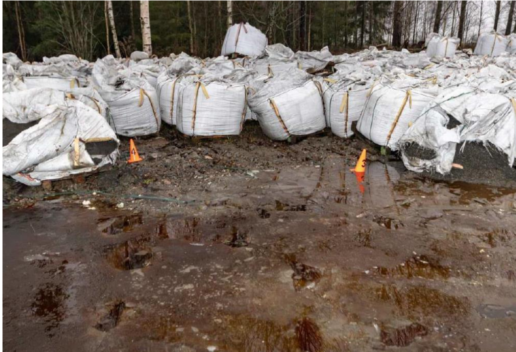
Bild 2020-03-09 från Härminge 1:5, Örebro kommun. Vattenprov säkrades vid säckarna, aktbilaga 6A s. 37.