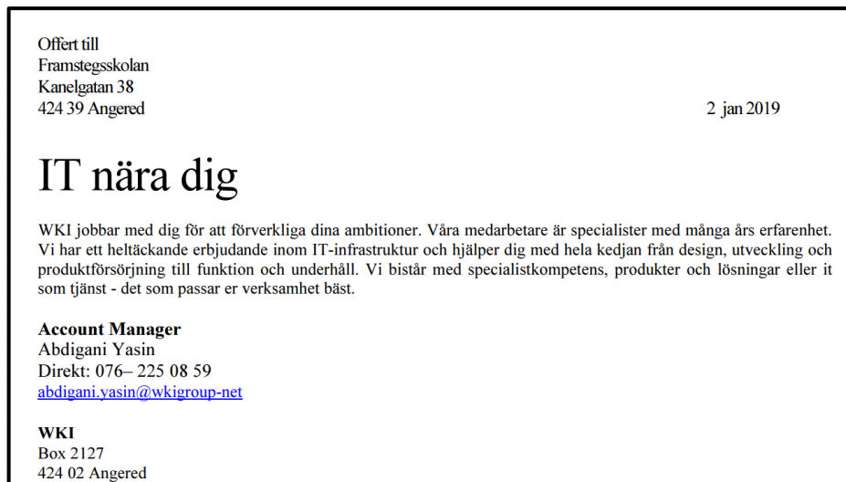
Bild 7. Offert ur förundersökningen, aktilaga 49, s. 472.

Även om han inte känner igen handlingen hade han den aktuella e-postadressen en kortare tid och det angivna telefonnumret är riktigt.