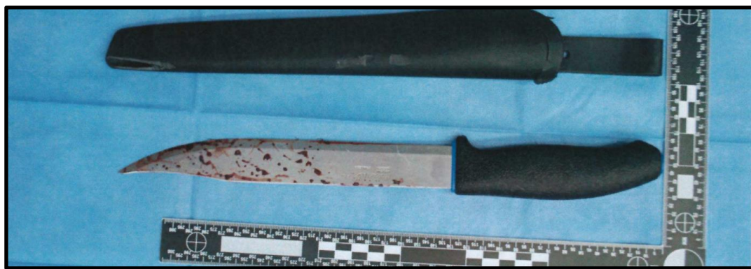
Fotografi på kniv påträffad i en papperskorg utanför Bangårdsgatan 15. 7

Av den skriftliga utredningen framgår att det fanns spår av blod på den kniv som påträffades i en papperskorg utanför Bangårdsgatan 15 den 9 april 2021 och som tagits i beslag. Resultaten av de analyser som Nationellt forensiskt centrum (NFC) genomfört talar extremt starkt för att blodet på knivens blad (intill spetsen) /DNA:t kommer från Cabdi Raxmaan Gure, om man bortser från möjligheten att det kommer från en nära släkting.