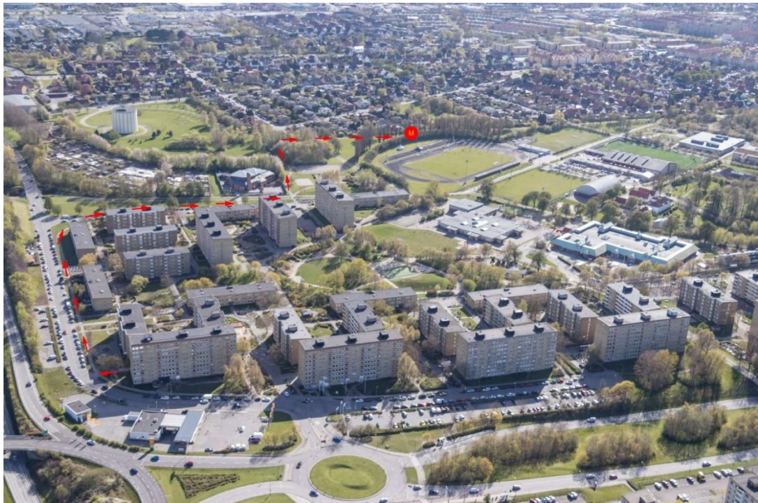
Figur 2.

Efter mordet körde skyttarna med mopeden till Ligustergatan. Där eldade de upp mopeden. Ett samtal kom till SOS kl. 19.35 att det var en brinnande moped vid idrottsplatsen vid Ligustergatan. Polisen var på plats någon minut senare och konstaterade att mopeden var helt utbränd.