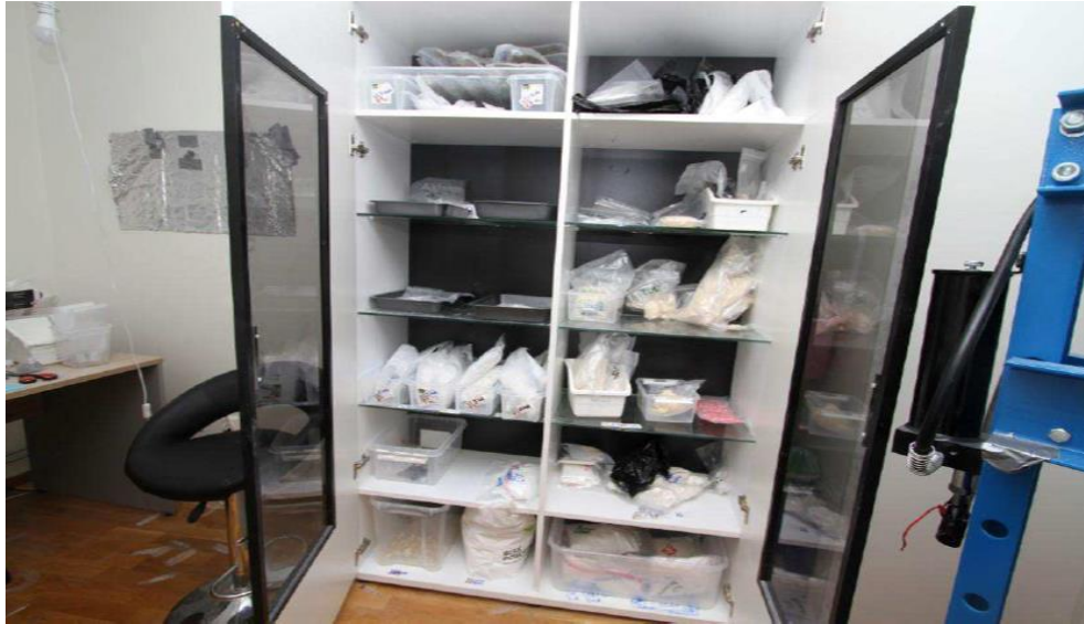
Dubbelgarderob med narkotika, verkstadspress till höger

Även fönstret i förpackningsrummet var försett med en rullgardin som tejpats fast. Där fanns garderober med bl a stora mängder vadderade kuvert, bubbelplast, plastrullar, limpistoler, limstift, frimärken och tejp. Där fanns även en dator kopplad till en etikettskrivare för att skriva ut adressetiketter från försäljningslistor. Samtliga föremål användes för att dölja att det fanns narkotika i försändelserna och förse dem med en bra "stealth" när de skickades med posten.