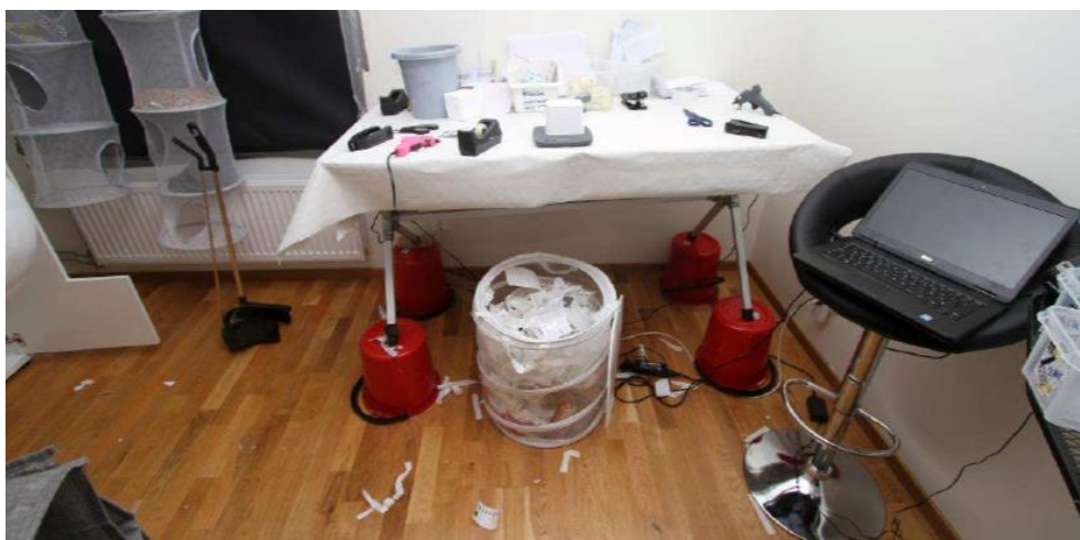
Förpackningsrum med etikettskrivare och tillkopplad dator

Även fönstret i förpackningsrummet var försett med en rullgardin som tejpats fast. Där fanns garderober med bl a stora mängder vadderade kuvert, bubbelplast, plastrullar, limpistoler, limstift, frimärken och tejp. Där fanns även en dator kopplad till en etikettskrivare för att skriva ut adressetiketter från försäljningslistor. Samtliga föremål användes för att dölja att det fanns narkotika i försändelserna och förse dem med en bra "stealth" när de skickades med posten.