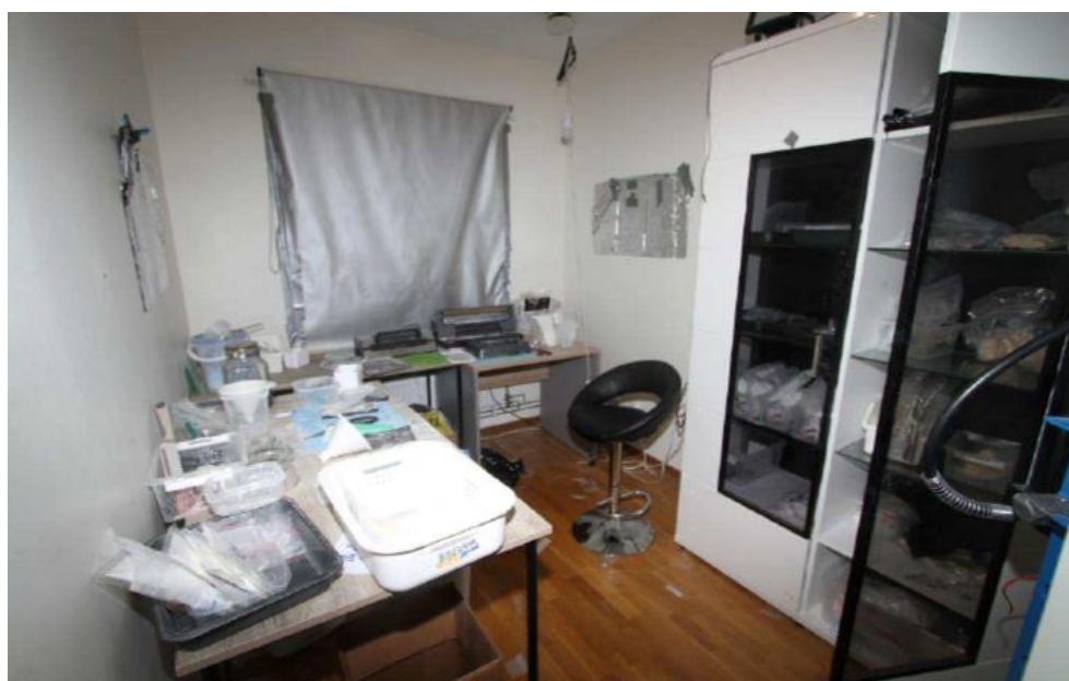
Bearbetningsrum med övertäckt fönster

Fönstret i bearbetningsrummet var försett med en neddragen rullgardin som tejpsats fast mot fönsterkarmen med silvertejp. Där fanns en välorganiserad dubbelgarderob där den huvudsakliga narkotikan förvarades, ett skrivbord där narkotikan blandades ut med bl a koffein, en verkstadspress med andningsmask där kokain ”bankades” och en vacuummaskin för att försegla den färdigdelade narkotikan. När narkotikan var vacuumförseglad flyttades den till förpackningsrummet. Se bilder nedan.