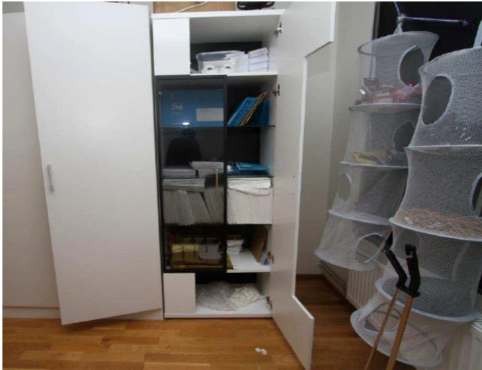
Garderob med kuvert och diverse förpackningsmaterial

Stora mängder förpackningsmaterial anträffades i lägenheten: 2 136 frimärken (till ett värde av 23 606 kr), 2 900 kuvert i olika storlekar, 550 förpackningskartonger, 71 plastflaskor med lock, 9 rullar med plast, 3 rullar med täckpapp och 25 rullar med inslagspapper, 300 vinylhandskar och 600 plasthandskar, 180 plastpåsar, 300 gummiband, 13 limpistoler och 176 limstift, 2 etikettskrivare med 5 380 adressetiketter, 4 häftapparater med 1 000 häftklamrar och 2 600 A4-papper.