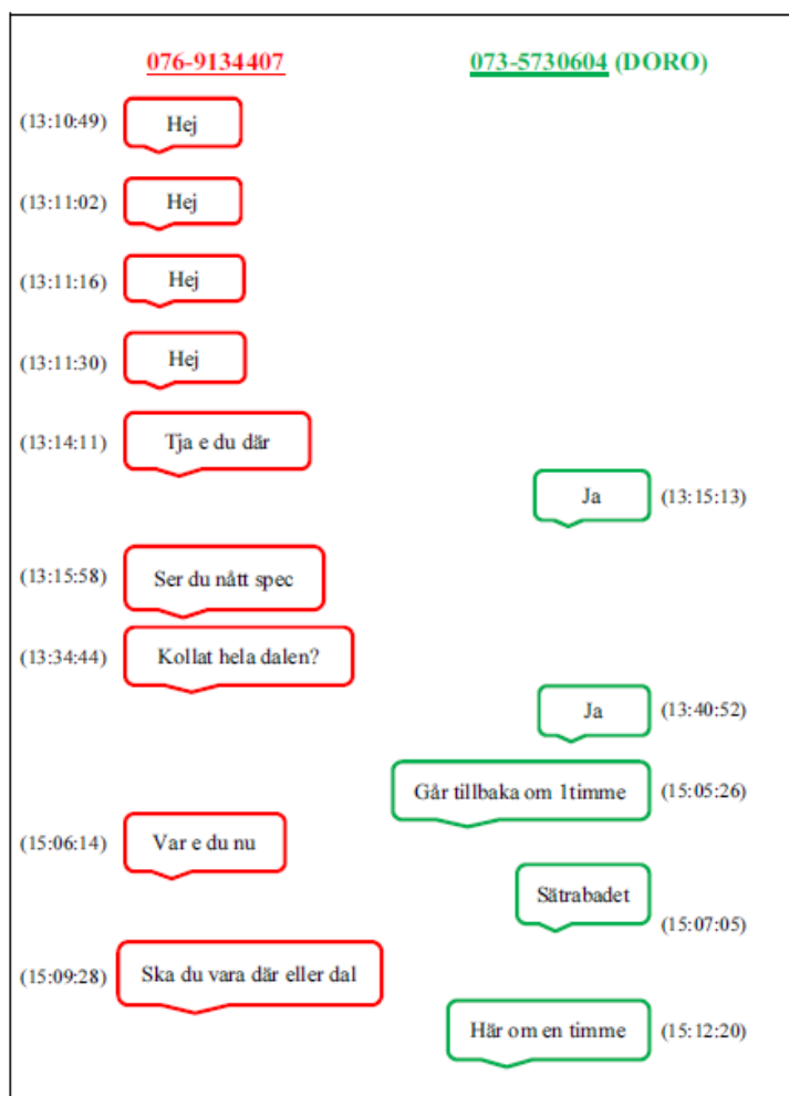
SMS-trafik mellan Doro och Nokia telefonerna den 1:a Aug 2020