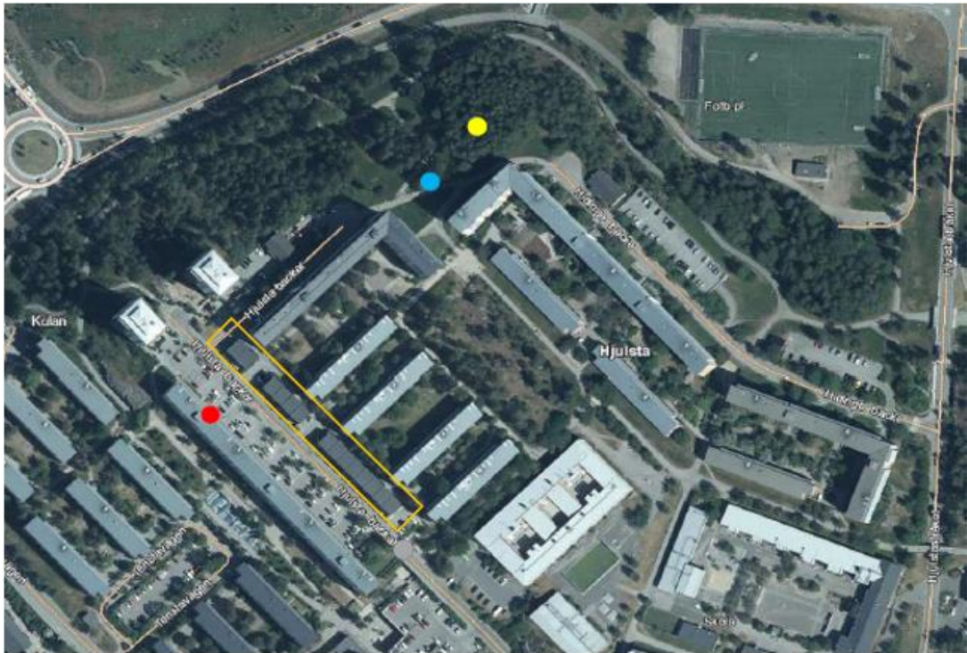
Karta över Hjulsta backar (s. 155 förundersökningsprotokoll, aktbilaga 460). Röd markering avser brottsplats, blå markering avser fyndplats för kläder och gul markering avser fyndplats för vapen. Inom den orangea rutan är de tre radhuslängor som hänvisas till nedan.