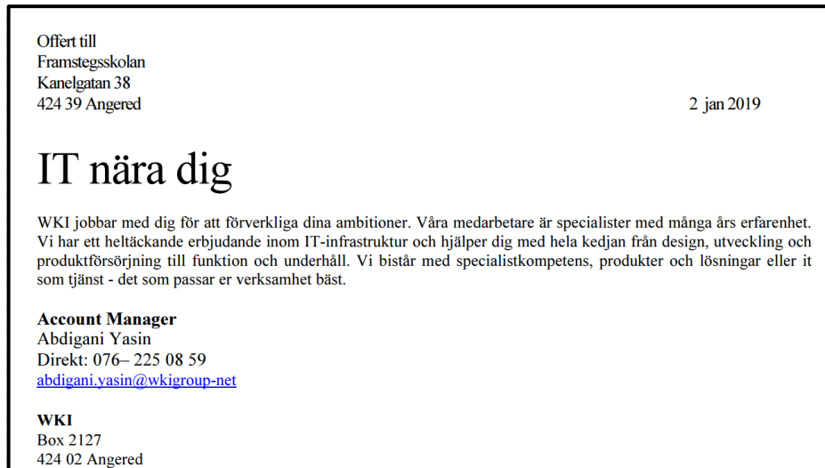
Bild 7. Offert ur förundersökningen, aktilaga 49, s. 472.

Även om han inte känner igen handlingen hade han den aktuella e-postadressen en kortare tid och det angivna telefonnumret är riktigt.