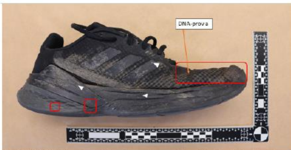
Figur 7. BG129707-4 Sko, vänster. Röda markeringar visar områden med kontaktspår. Vita pilar markerar blodstänk. Läge för DNA-prova markeras.