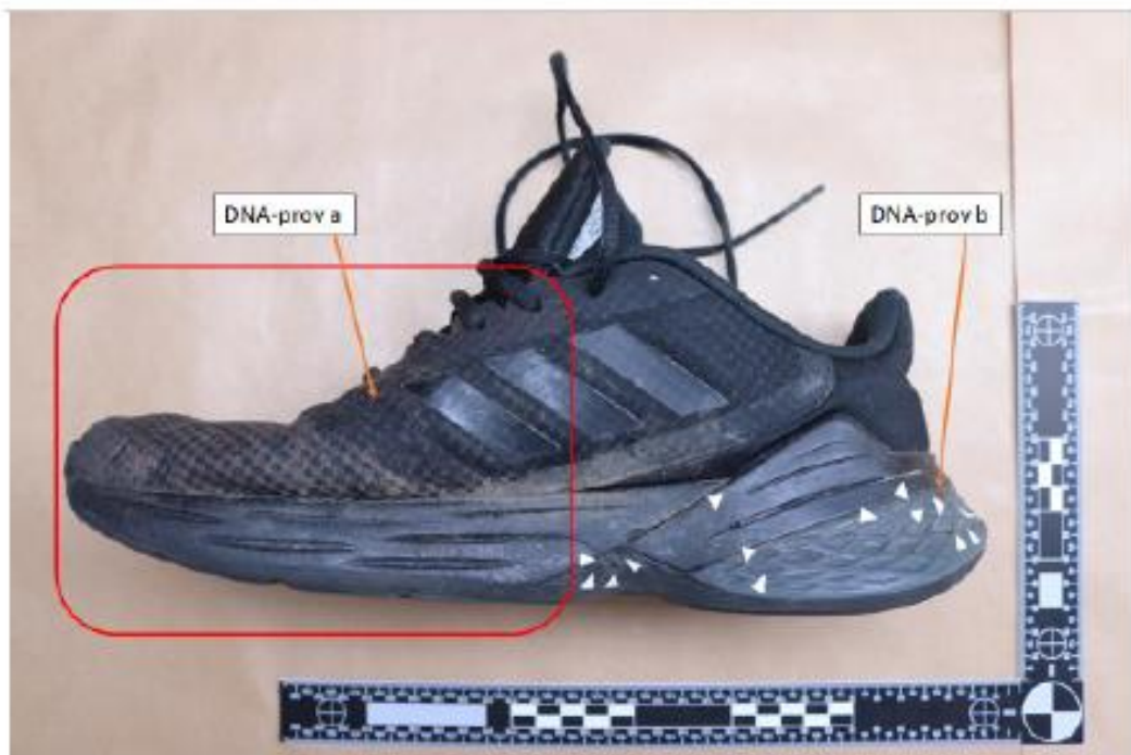
Figur 2. BG129707-3 Sko, höger. Röd markering visar område med kontaktsår. Vita pilar markerar blodstänk. Läge för DNA-prov a och b markeras.