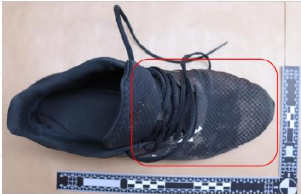
Figur 4. BG129707-3 Sko, höger. Röd markering visar område med kontaktsår. Vita pilar markerar blodstänk.