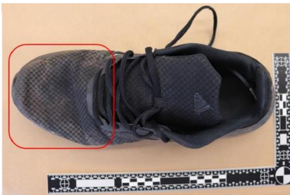
Figur 8. BG129707-4 Sko, vänster. Röd markering visar område med kontaktspår.