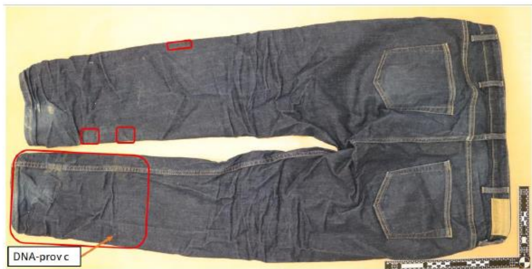
Figur 11. BG129707-5 Byxor, baksidan. Röda markeringar visar områden med kontaktsår. Läge för DNA-prov c markeras.

NFC:s samlade bedömning av blodförekomsten på höger sko, vänster sko och byxor är följande.