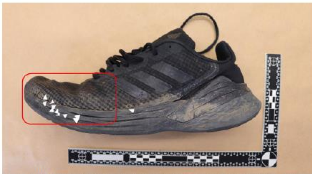
Figur 6. BG129707-4 Sko, vänster. Röd markering visar område med kontaktpår. Vita pilar markerar blodstänk.