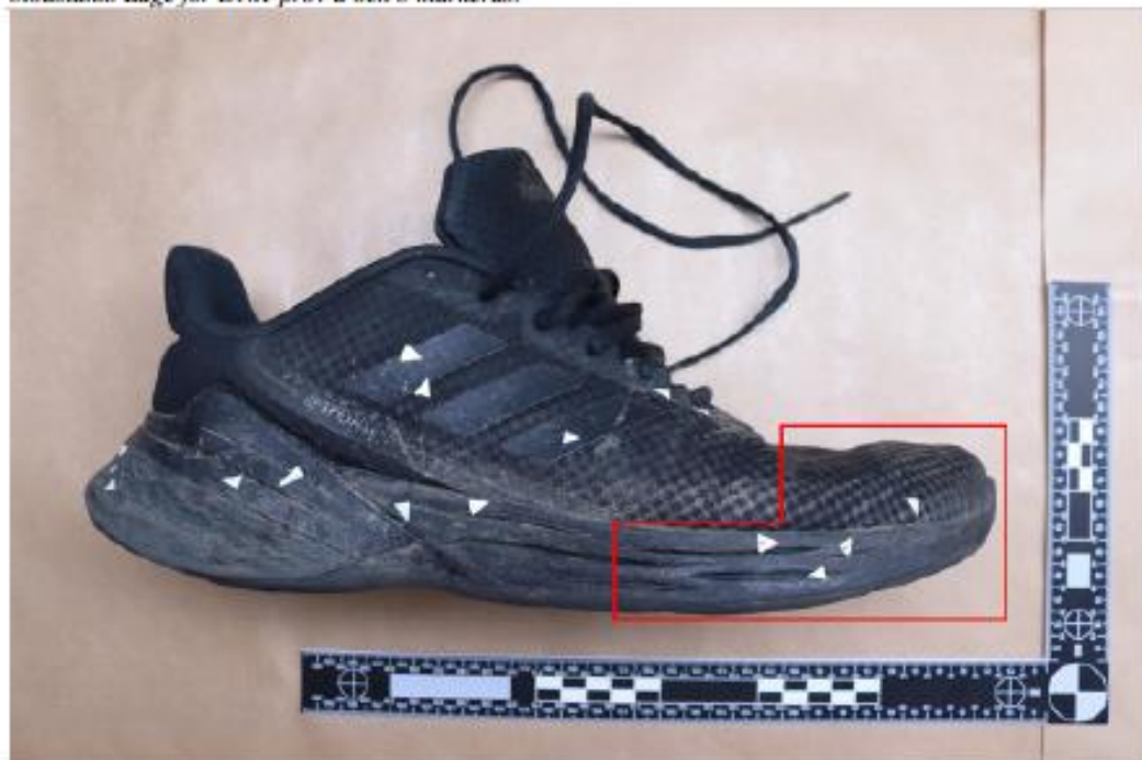
Figur 3. BG129707-3 Sko, höger. Röd markering visar område med kontaktsår. Vita pilar markerar blodstänk.