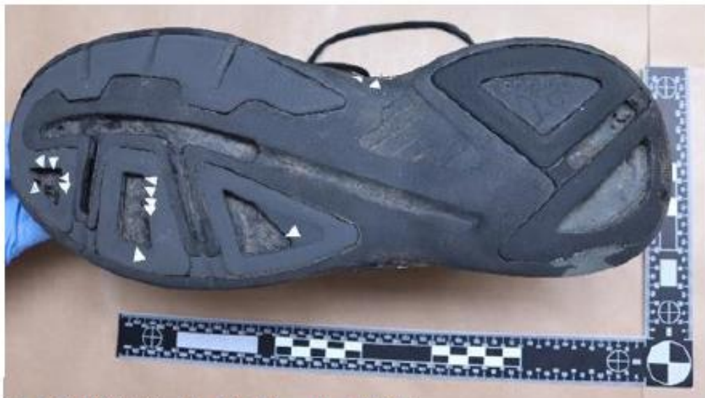
Figur 5. BG129707-3 Sko, höger. Vita pilar markerar blodstänk.