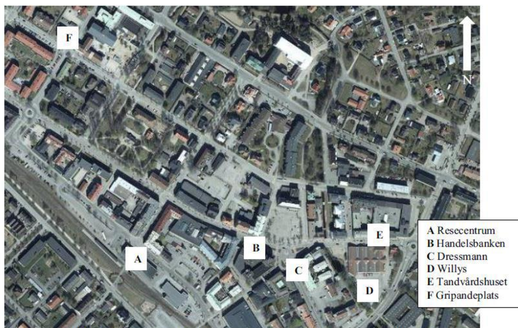
Bild 2. Satellitbild över centrala Vetlanda med markerade brottsplatser.