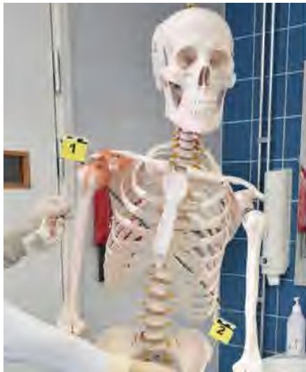
Ingångshål (1), sårkanal och utgångssår (2)

Enligt det rättsmedicinska utlåtandet var det fråga om ett fjärrskott. Vidare talade fynden och omständigheterna starkt för att skottskadan orsakades av skjutvåld genom skott med kulammunition, att Youssef El Emam avled till följd av skottskadan och att döden orsakades av annan.