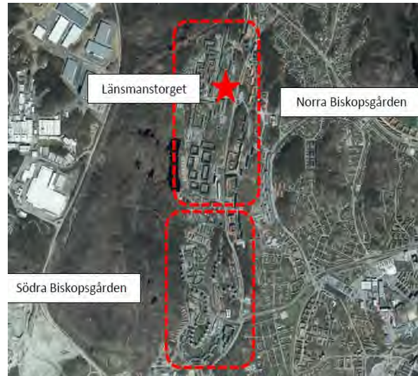
Områdena i Biskopsgården

Färdväg bilen (röd sträcka) och scooterar (röd, avslutningsvis gul, sträcka)