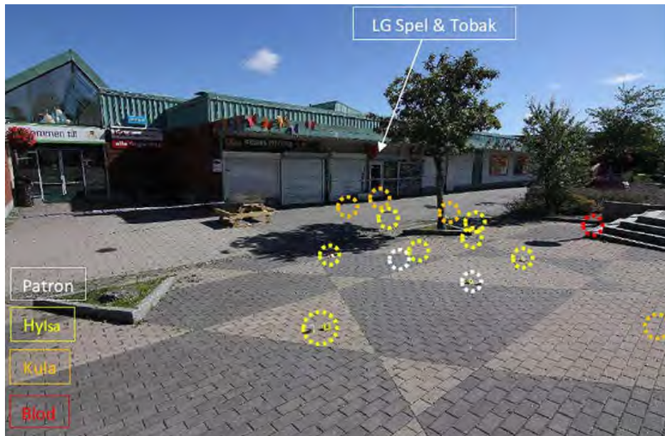
Anträffade patronhylsor, patroner, kulor och blod sett från kyrkan.