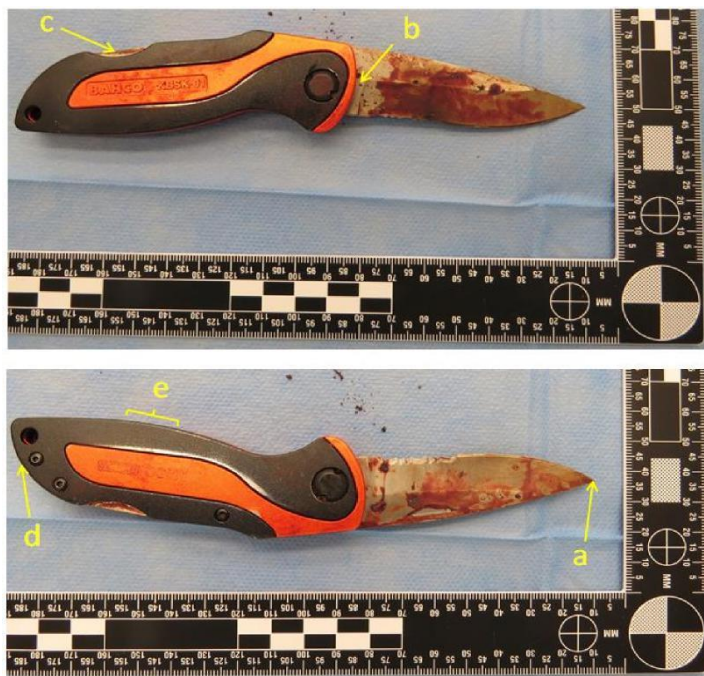
Foto på kniven.