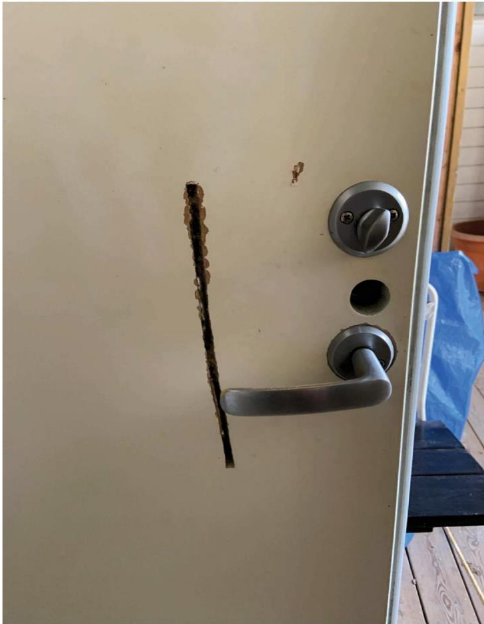
Foto på ytterdörrens insida.