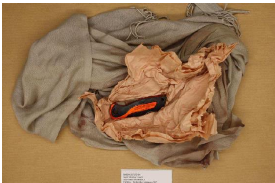
Foto på beslag BG45063 som det inkom till Forensiska Stationen i Halmstad.

Den 13 april 2021 togs en kniv i beslag (2021-BG45063 nr. 1). Kniven hade lagts i en moské i Andersberg och låg inlindad i papper samt i en sjal.