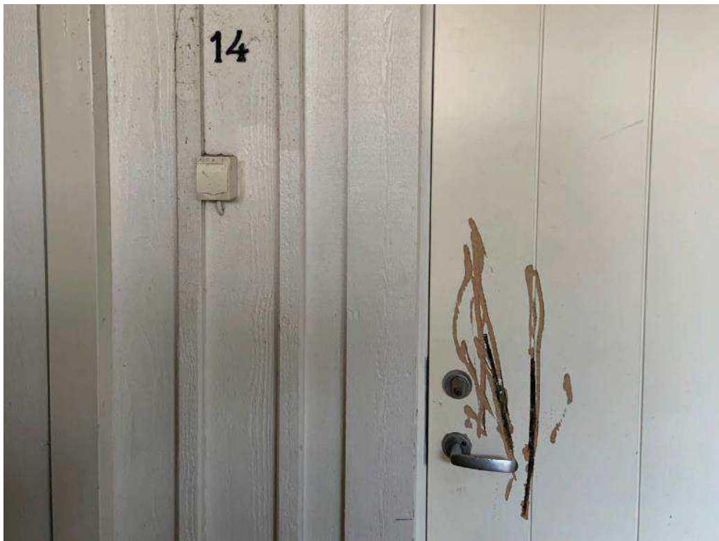
Foto på ytterdörrens utsida.