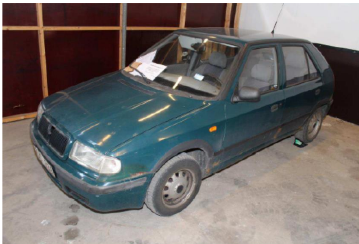
Foto på den i beslag tagna bilen.

I samband med gripandet togs en grön personbil av märket Skoda Felicia LX 1.6 med registreringsnummer RUC 338 i beslag (2021-5000-BG42344 nr. 1). Bilen påträffades på en parkeringsplats utanför Akutmottagningen vid Hallands sjukhus i Halmstad. Det fanns inga synliga skador i de yttre låsen. Vänster vindrutetorkare samt "SKODA"-märket i grillen fram saknades. På utsidan av B-stolpen på både vänster och höger sida fanns blodlika besudlingar.