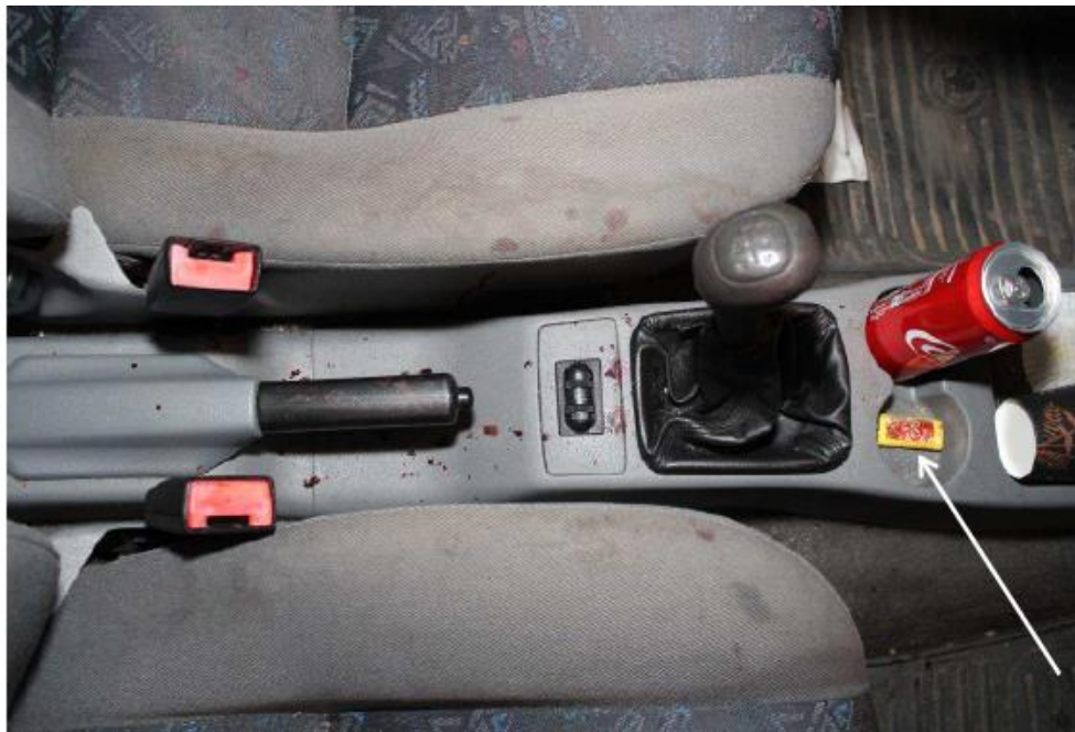
Foto på utrymme mellan förarplats och passagerarplats fram. G021 markerad med pil.

Mellan förarplatsen och passagerarplatsen fram fanns blodlika besudlingar på bland annat växelspaken och handbromsen. I ett utrymme framför växelspaken stod en ”Coca Cola”-burk och bredvid den låg en gul tändare (G021) med blodlika besudlingar på. På tändaren säkrades en blodlik besudling (S028).