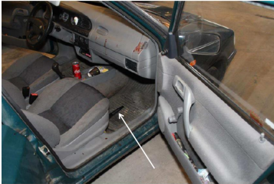
Foto på passagerarplats fram. G020 markerad med pil.

handskfacklocket. Besudlingen bedömdes vara en avsättning och avsatt då handskfacklocket stått öppet. På golvet på passagerarplatsen fram fanns flera blodlika besudlingar som bedömdes vara droppat blod. På golvet på passagerarplatsen fram låg en svart påfyllnadspip i plast (G020) som säkrades. På påfyllnadspipen fanns blodlika besudlingar som bedömdes vara droppat blod.