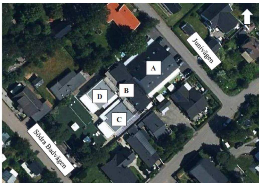
Foto på byggnaderna.

På den aktuella adressen finns det flera byggnader. Byggnaderna ligger tätt inpå varandra och samtliga har träfasad och trästomme. De olika byggnaderna på adressen benämns byggnad A tom D. Tomten som byggnaderna ligger på sträcker sig mellan Södra badvägen och Junivägen. Byggnad "A" är en två-plans byggnad med totalt 12 lägenheter. Byggnad "B" är en tvåplans byggnad med totalt 6 lägenheter och en tvättstuga. Byggnad "C" är en en-plans byggnad med 5 lägenheter, ett kontor samt ett pannrum. Byggnad "D" er en en-plans byggnad med totalt 6 lägenheter. Mellan byggnad B, C och D fanns ett utskjutande tak i plast och plåt.