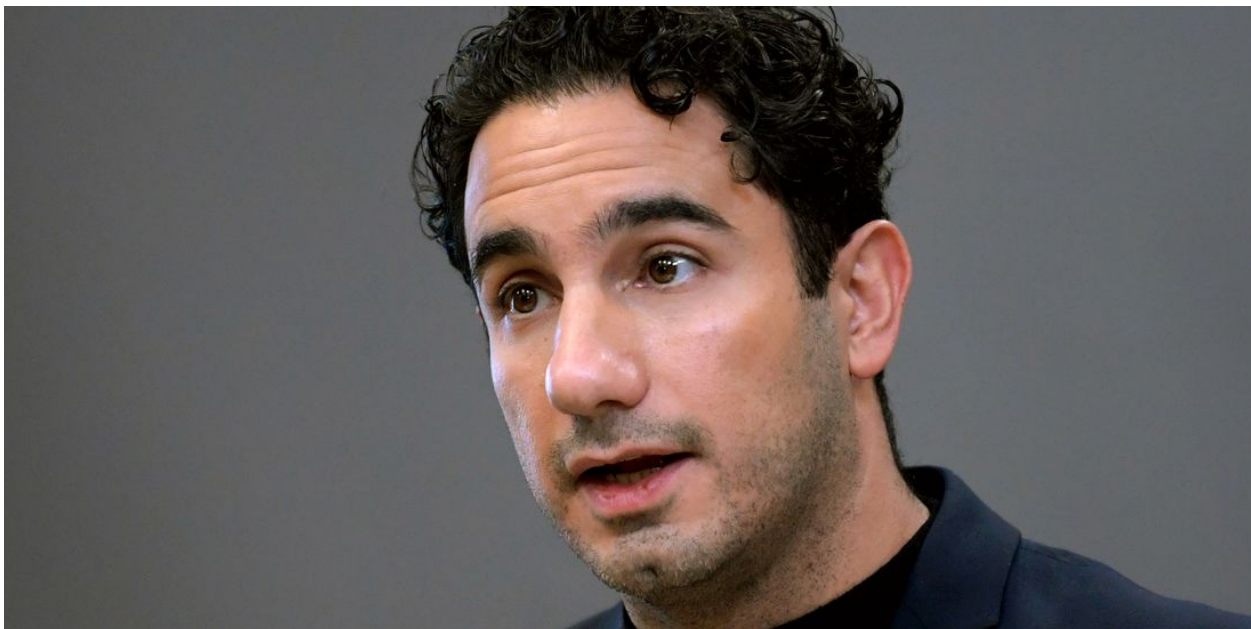
Civilminister Ardalan Shekarabi (S).

INKOM: 2021-01-18 MÅLNR: B 2006-20 AKTBIL: 163