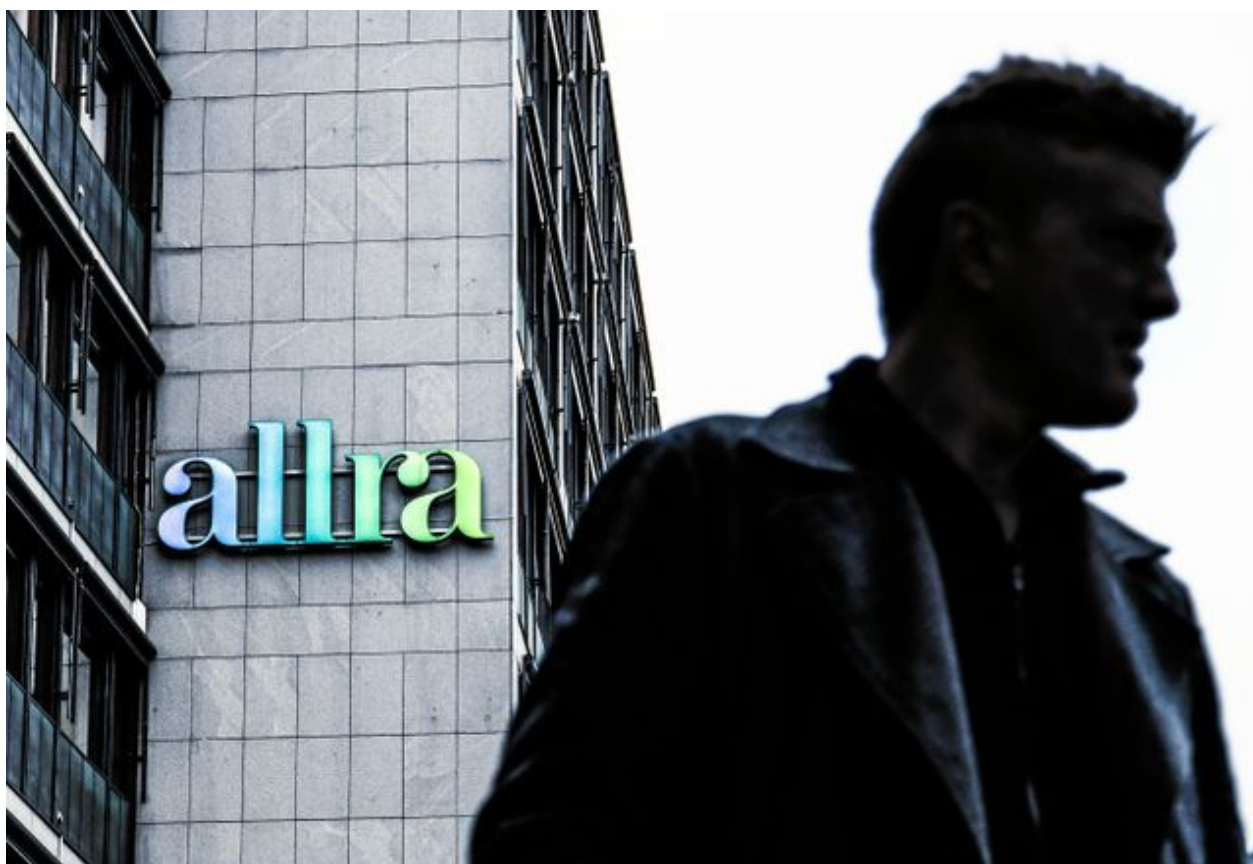
Allras fonder erbjöds när det begav sig på premiepensionens fondtorg, i vardagligt tal kallat PPM.

– Hela det här arbetet, även framåt, syftar till ett tryggt och bra PPM-system som en självklar del av socialförsäkringen. Vi jobbar för att det ska vara just en sådan del av den allmänna pensionen, säger hon.