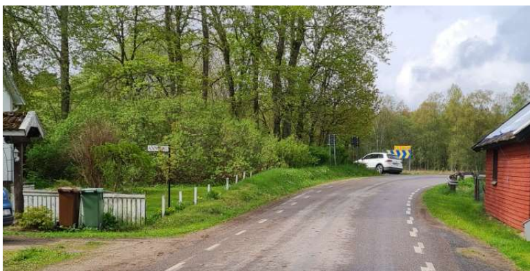
Skymd kurva vid anvisad på- och avstigning vid den allmänna vägen