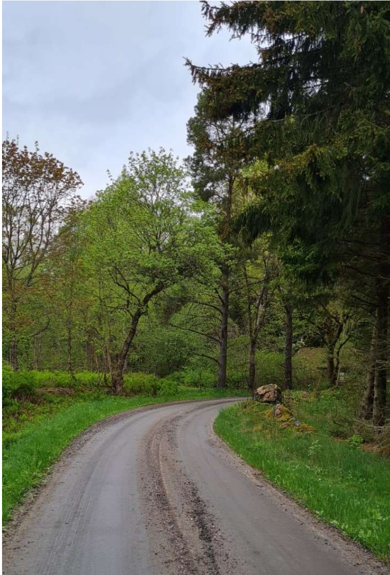
Exempel på skymd kurva med stenmur som ointetgör väjning