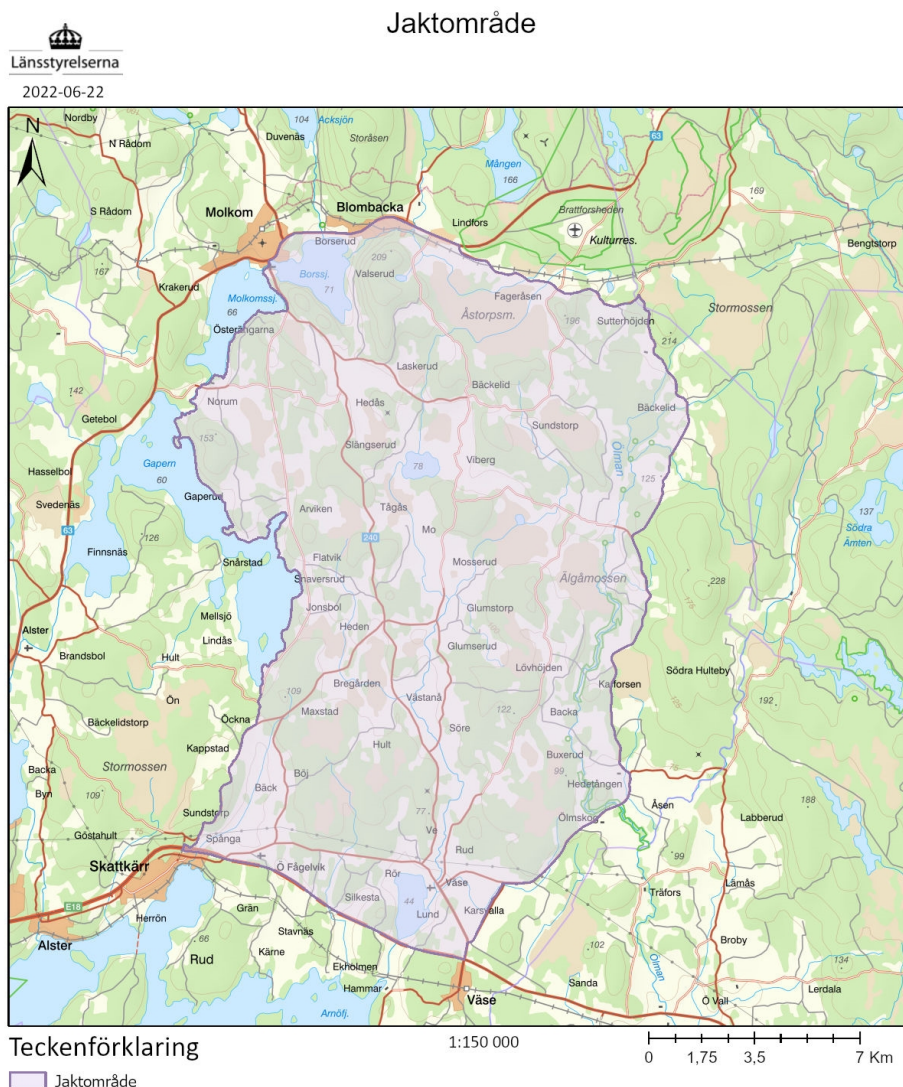
Figur 1: Jaktområdet avgränsas mestadels av väg samt vid strandkanten till sjöarna Molkomssjön och Gapern.

Skyddsjakt får ske inom angivet område enligt kartan (finns även i bilaga 2). Jakt får ske på annans mark.