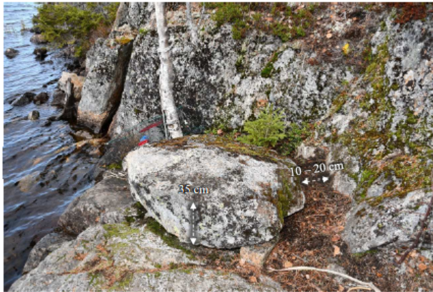
Figur 80. Måttangivelser för stenen och kilen på nedre platan.

Genom utredningen har framgått att Allan Karlström är 187 cm lång och väger cirka 135 kilo. Liselotte Ylivainio var 157 cm lång och vägde cirka 42 kilo.