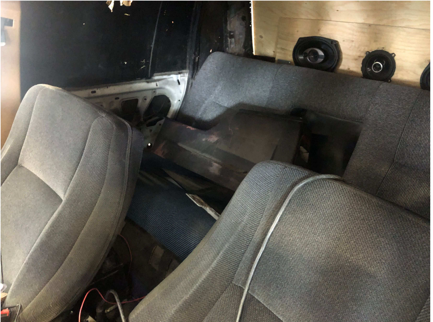
5. CMW157 vägg bakom framstolar saknas