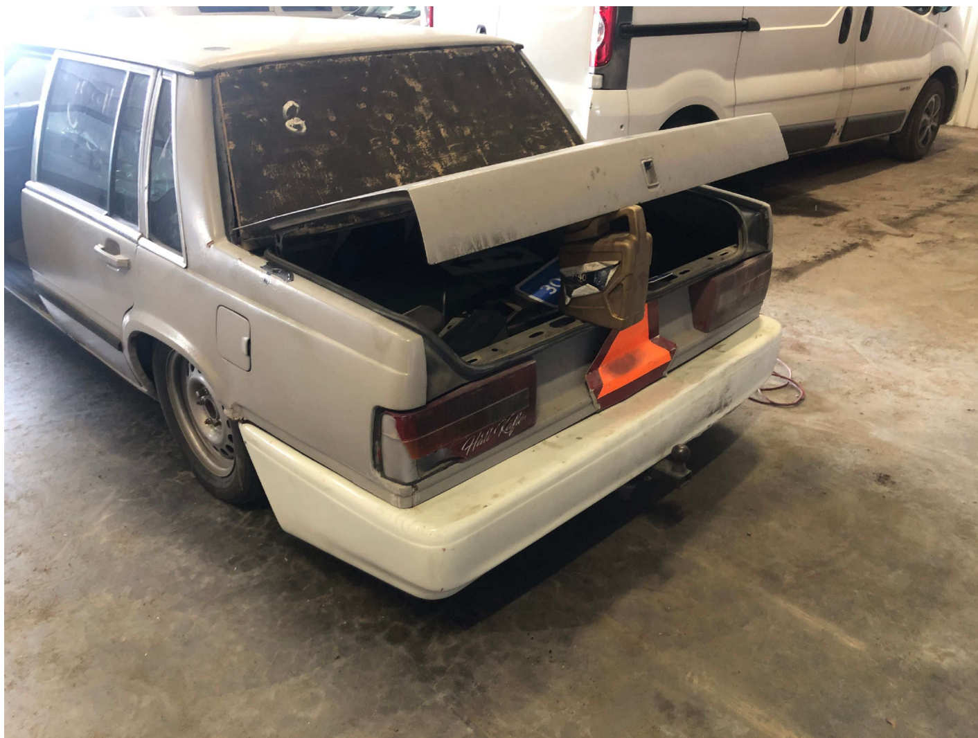
4. CMW157 baklucka öppningsbar. barlastflak saknas