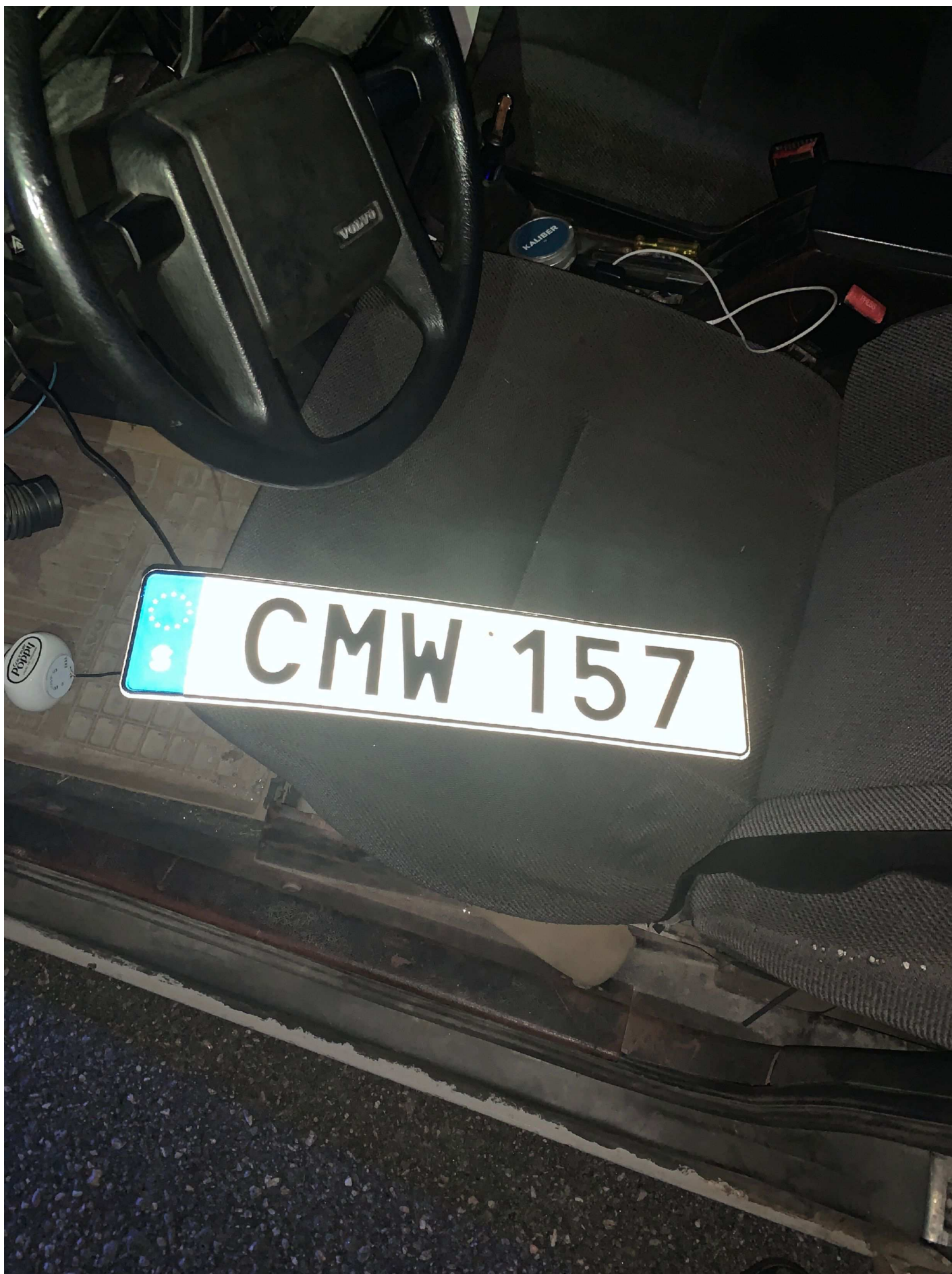
3. Reg. skylt till fordonet låg nedtryckt mellan förarsäte och mittkonsol