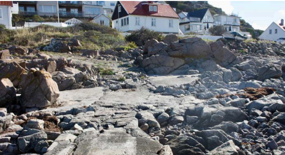
Här vill kommunen bygga en ny badbrygga. Kostnaden är satt till runt 600 000 kronor.